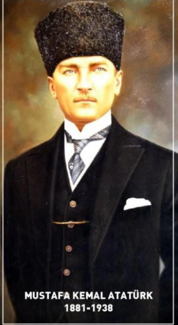
MUSTAFA KEMAL ATATÜRK 1881-1938